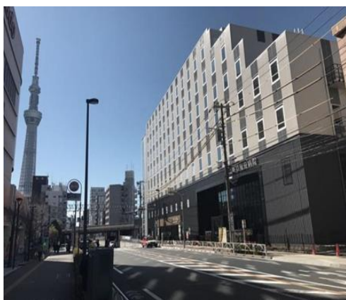
△「東京曳舟病院」外観