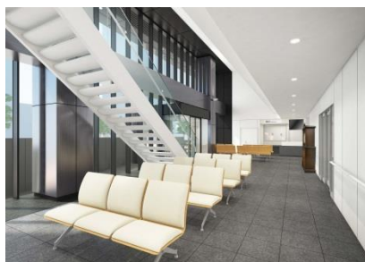
△外来待合室(イメージ)