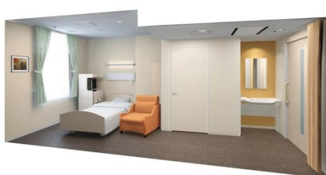
△一般病室(1床室)(イメージ)