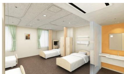
△一般病室(4床室)(イメージ)