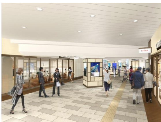
△「EQUiA（エキア）曳舟」（イメージ）