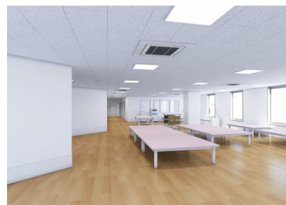
△7階 リハビリテーション室(イメージ)