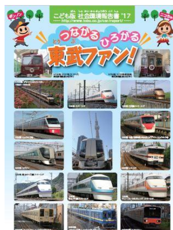
△こども版社会環境報告書