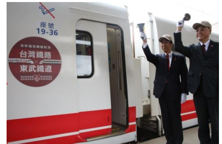
△台湾での出発式の様子