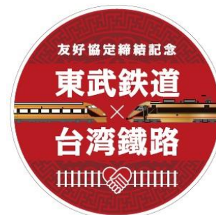
△ 記念エンブレム(イメージ)

本エンブレムのデザインは、台鉄との連携施策第1弾、第2弾にて実施した特急スペーシアおよび特急「りょうもう」号と自強号「普悠瑪」でのエンブレム掲出において使用したデザインを基本とし、一体感を創出しています。