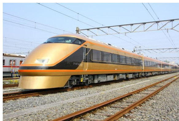
△東武鉄道「日光詣スペース」