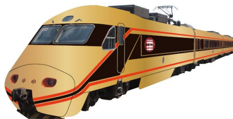
△台鉄自強号 ラッピングデザイン変更イメージ