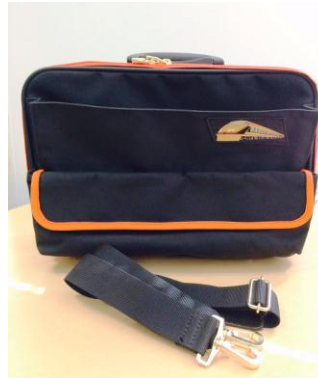
△ 東武鉄道運転士用カバン（イメージ） レプリカ・限定20個・20,000円（税込） シリアルナンバー入り

※上記2商品については、会場にてお一人様1つの商品につき1枚の整理券を配付します ※ジャンク品の販売は行いません