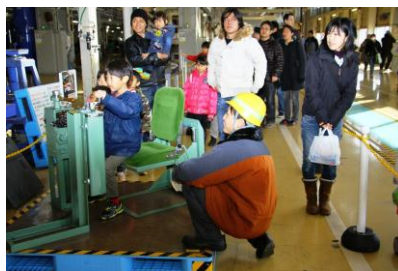
△ 昨年開催の東武ファンフェスタの様子