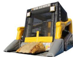
△ フワフワ（イメージ）