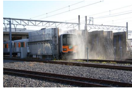
△ 軌陸両用型架線作業車・車両洗浄線を走る電車 体験乗車（イメージ）