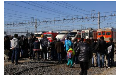
△ 車両撮影会（イメージ）