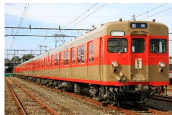
△ 「フライング東上号」リバイバル車両（8198号編成・4両） （イメージ）