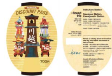
KAWAGOE DISCOUNT PASS

・東上線で初めての訪日外国人旅行者向けの企画乗車券を発売(15年2月～発売開始)