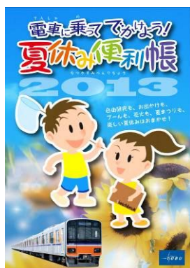
▲夏休み便利帳(イメージ)

東上線の歴史や鉄道スポットにまつわる「ウンチク」や車窓からの「ビューポイント」をまとめたパンフレットです。パパ鉄、ママ鉄、子鉄はもちろんのこと、鉄道に詳しくなくても、このパンフレットを持って出かければ、東上線の魅力を感じていただけます。