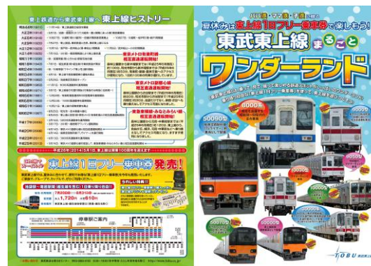
▲東武東上線まるごとワンダーランド(イメージ)