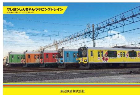
△「東武鉄道クレヨンしんちゃんラッピングトレイン」デザインのポストカード（イメージ）