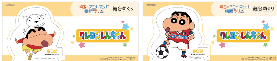
△「クレヨンしんちゃん」オリジナルぶちパネル（2枚セット）