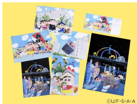
△「クレヨンしんちゃん絵はがきセット第2弾」セット内容

※12月16日(土)・12月17日(日)10:00~17:00、サトーココノカドー(イトーヨーカドー)春日部店 駅側店頭入口スペースにて出張販売