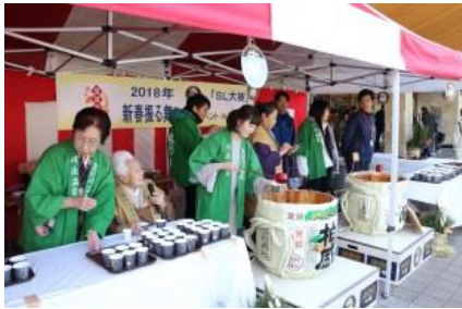
△昨年の振る舞い酒の様子