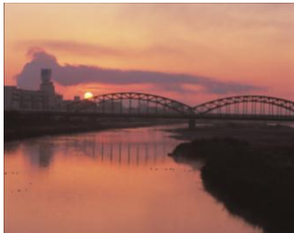
足利市～野州山辺間