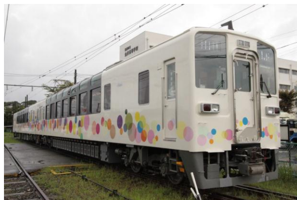
△展望車両634型 「スカイツリートレイン」