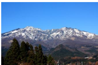
下今市～東武日光間