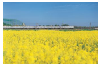
大宮公園～大和田間