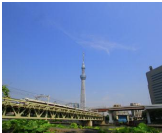
浅草～とうきょうスカイツリー間