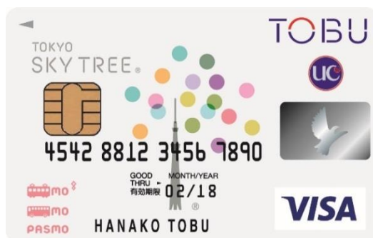
△東京スカイツリー®東武カードPASMO