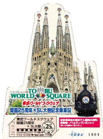
△「東武ワールドスクウェア開園25周年」記念乗車証と