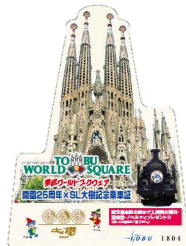
△「東武ワールドスクウェア開園25周年」 記念乗車証(イメージ)