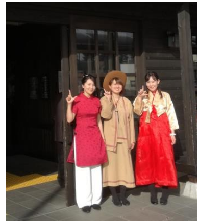
△SL観光アテンダントによる民族衣装着用 (イメージ)