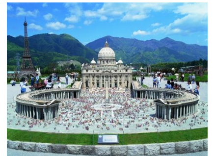
△サン・ピエトロ大聖堂(イメージ)

東武ワールドスクウェアは、「世界の遺跡と建築文化を守ろう」をテーマに1993年4月に開園しました。世界文化遺産に登録されている46物件を含め、合計102点の有名建築物を25分の1スケールで精巧に再現しています。2010年4月には「東京スカイツリータウン」、2015年には台湾台北市の超高層ビル「台北101」の展示を開始しており、2018年4月21日(土)からは台湾新北市富貴岬「富貴角灯台(ふきかくとうだい)」の展示を開始します。