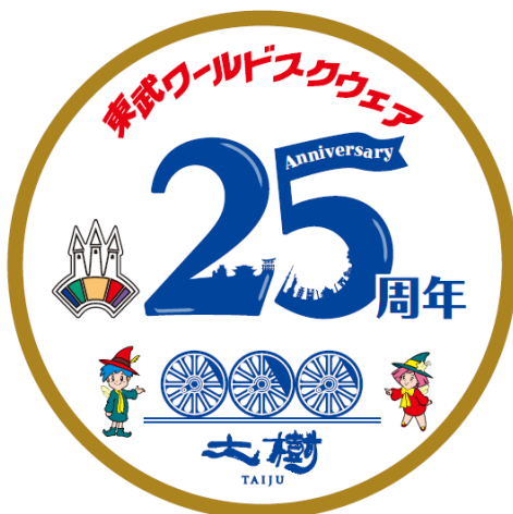
△オリジナルヘッドマーク(イメージ)

ぜひ、この機会に春の日光・鬼怒川エリアへご家族やご友人とお出かけください。 詳細は、別紙のとおりです。