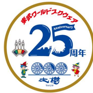
△オリジナルヘッドマーク(イメージ)