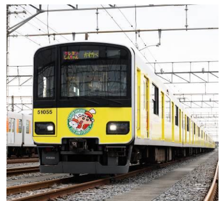
△ 現在運行しているラッピングトレイン