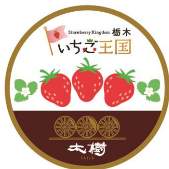
△S L「大樹」ヘッドマーク（イメージ）