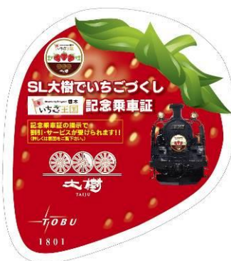
△SL「大樹」1～4号 (共通) の「いちご王国」記念乗車証 (イメージ)