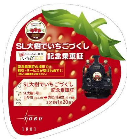
△「いちご王国」記念乗車証と SL「大樹」5・6号限定硬券仕様特製記念乗車証セット (イメージ)