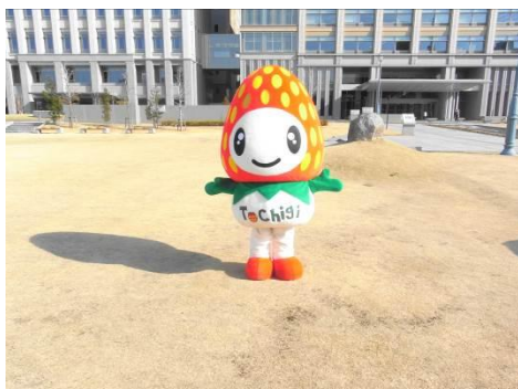
△JA全農とちぎキャラクター「トチゴくん」

1月20日(土)・21日(日) 下今市駅構内転車台広場 12:10~、15:35~