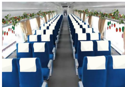
△14系客車内装飾（イメージ）