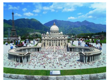
△サン・ピエトロ大聖堂

東武ワールドスクウェアは、「世界の遺跡と建築文化を守ろう」をテーマに1993年4月に開園しました。世界文化遺産に登録されている46物件を含め、合計102点の有名建築物を25分の1スケールで精巧に再現しています。2010年4月には「東京スカイツリータウン」、2015年には台湾台北市の超高層ビル「台北101」の展示を開始しています。また、秋季～冬季にかけて「イルミネーション営業(夜間営業)」も開催しています。