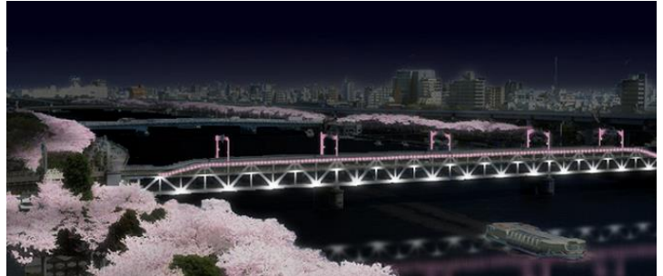
△隅田川周辺の桜とのコラボレーションイメージ