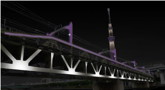
△東京スカイツリーのライティングとの コラボレーションイメージ

日々のライトアップは、東京スカイツリーの「粋」「雅」「幟」の3つのライティングをイメージした同系色とすることで、東京スカイツリーのライティングとのコラボレーションを日替わりで楽しんでいただけます。また、隅田公園桜まつりなど、四季折々行われる地域のイベント等、その時々に応じたライトアップも行います。