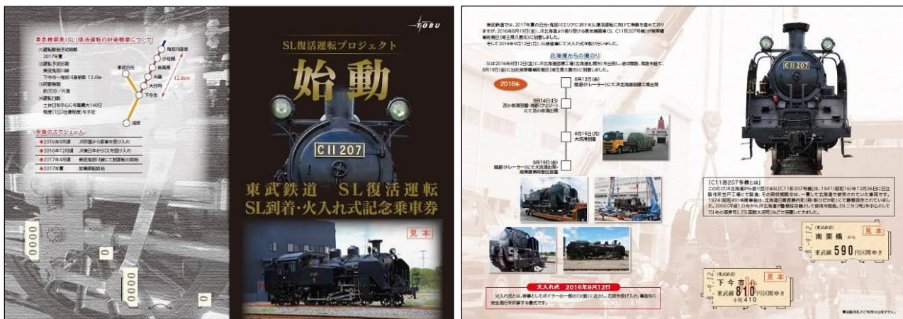
△ 「東武鉄道 SL復活運転 SL到着・火入れ式記念乗車券」台紙イメージ