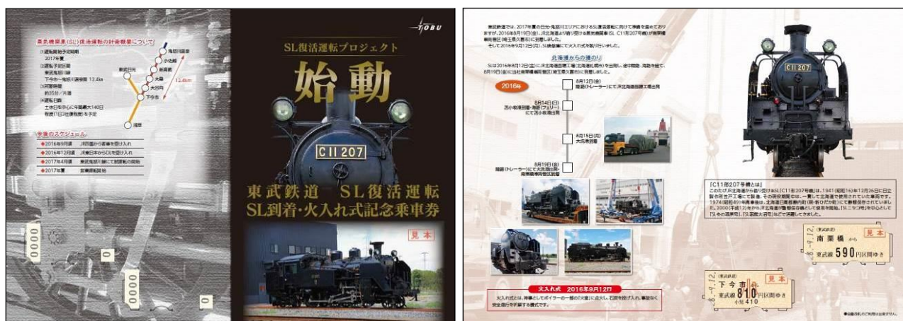
△ 「東武鉄道 SL復活運転 SL到着・火入れ式記念乗車券」台紙イメージ