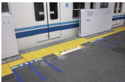
「お客さまの流動」について

⇒60000系においては、説明ステッカーの貼付け位置を窓の両側に変更しました。(平成26年5月～)