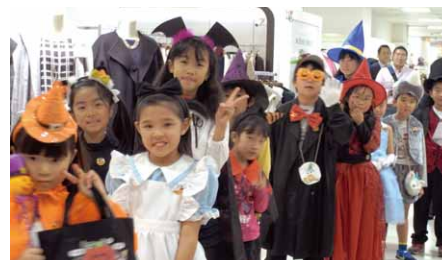
「ハロウィン・キッズパレードin宇都宮」