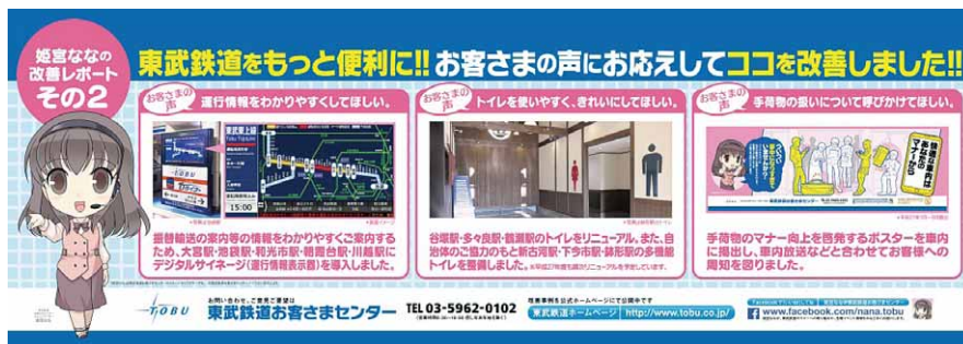
「姫宮ななの改善レポートその2 (列車内ポスター)」

2014年度は、お客さまの声から改善された事例が30件ありました。また、お寄せいただいた声を参考に、当社のメッセージをお伝えすることで、お客さまが安全に、安心して鉄道をご利用いただける環境づくりをお客さまと一緒にめざしていこうと、マナーポスターや改善事例をご紹介するポスター等を作成しています。駅構内、列車内への掲示等を通じて、お客さまのご理解とご協力を呼びかけています。