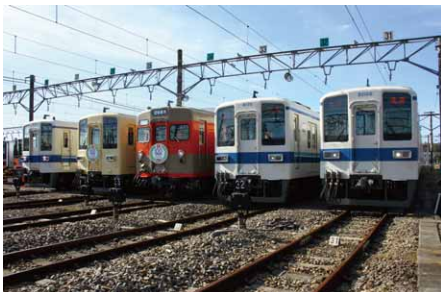
「東上線 森林公園 ファミリーイベント2014」を開催 ('14年11月16日に森林公園検修区)