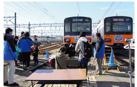
「子ども制服着用体験」