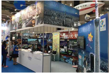
「台北国際旅行博」の様子