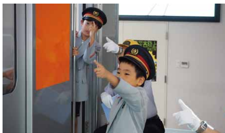
「電車のおしごと教育訓練体験会」