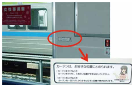
「60000系のカーテン使用説明ステッカー」について

お客さまの声：「車両の窓にカーテン使用の説明書きが貼ってあるが、カーテンが閉まっている時は、説明ステッカーを読むことができないので、見やすい場所に変更してほしい。」