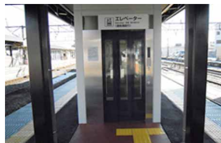
「エレベーターの新設」について

お客さまの声：「電車を降りる際、乗る人とぶつかってしまうので何とかしてほしい。」 ⇒電車を降りられたお客さまは階段へ向かわれるので、矢印ステッカーを貼り、お客さまがスムーズに乗降できるようにしました。