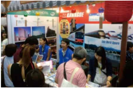
「タイ国際旅行博」の様子