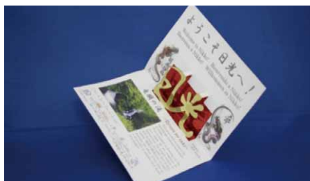
「オリジナルシート(内側)」

同プロジェクトでは、日光・鬼怒川地区にお越しになられたお客さまへのおもてなしとして、思い出に残していただけるよう、インスタント写真「チェキ」でお客さまを撮影し、同地区のパワースポットが描かれたオリジナルシートに挟んでプレゼントする取り組みを行っています。