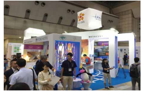
「ツーリズムEXPOジャパン」の様子