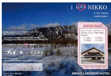
「オリジナルシート(外側)」