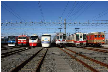
「2014 東武ファンフェスタ」を開催 ('14年12月7日に南栗橋車両管区)