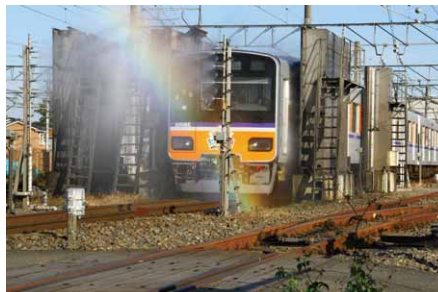
「車両洗浄線を走行する電車の体験乗車」