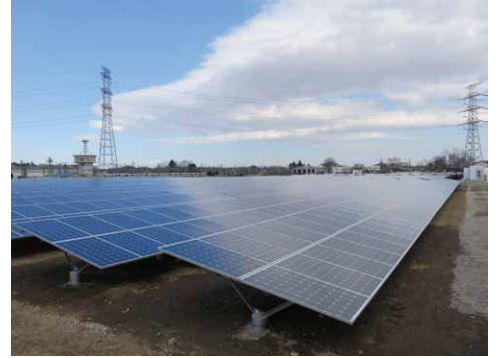
東武森林公園太陽光発電所 (埼玉県比企郡滑川町)

当該5か所は、これに引き続いて同制度により実施しました。現在稼働している6か所合計の設備容量(太陽光パネル容量)は6,530kW、年間発電量は約706万kWh(一般家庭約1,963世帯分)、年間CO 2 削減量は約3,566トン(約32万4千本のブナの木を植林したのと同程度の効果)です。