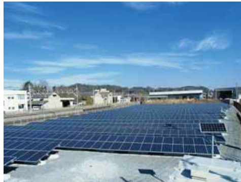
佐野田沼太陽光発電所 (栃木県佐野市)