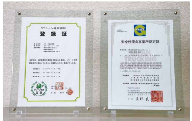
「グリーン経営認証登録証」&「安全性優良事業所認定証」

あわせて、公益社団法人全日本トラック協会が認定する安全・安心な運送事業所である「安全性優良事業所認定」も取得して安全輸送に努めています。