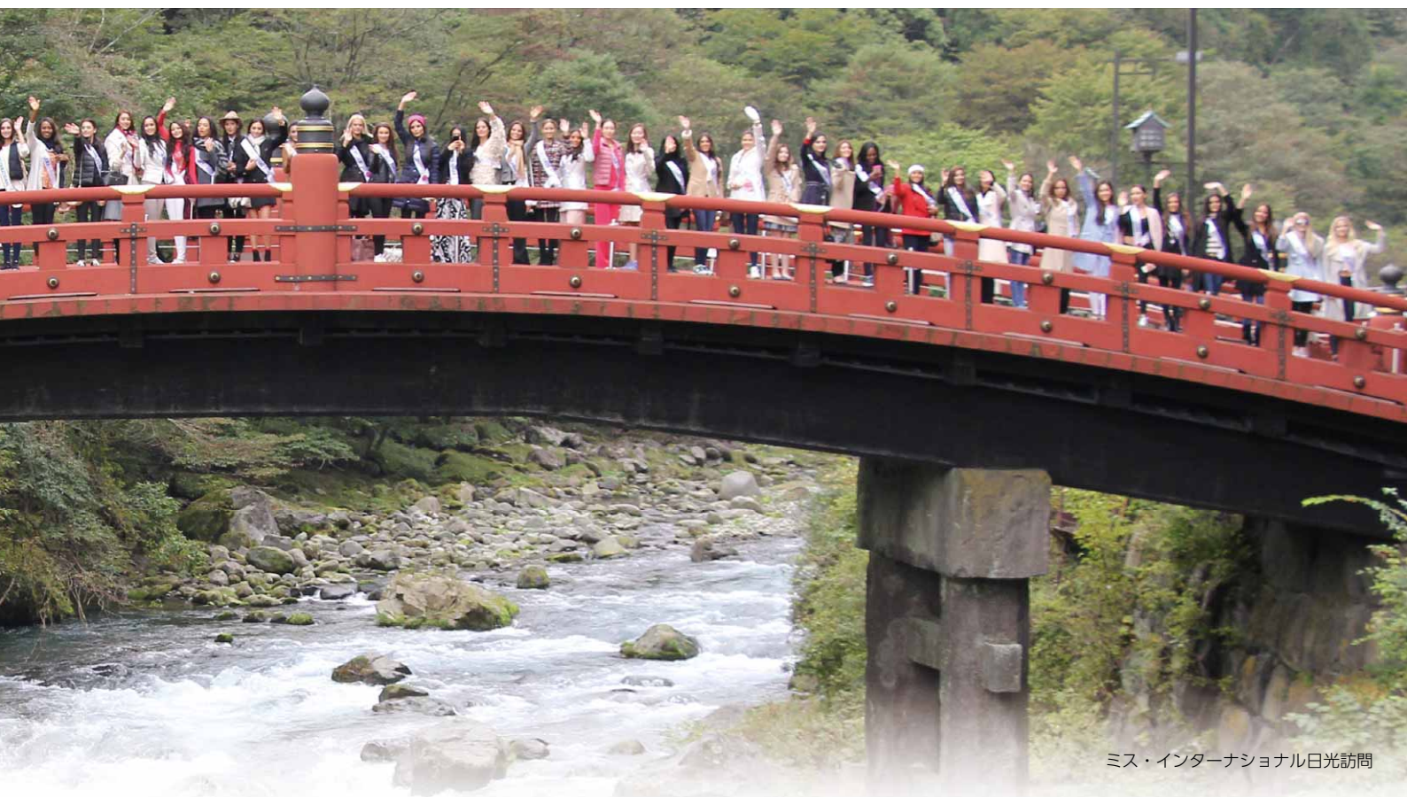
ミス・インターナショナル日光訪問