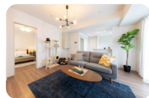
ソライエアイル岩槻

賃貸マンション「ソライエアイル岩槻」とサービス付き高齢者向け住宅はそれぞれペットとの共生をコンセプトとしており、両物件の入居者が共用することのできるドッグランを設置することで、ペットとの共生を通じて多世代交流の促進を図っています。