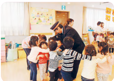
江戸川台保育施設でのイベント状況

2012年から保育施設の誘致を進めており、2022年4月には新たに東武アーバンパークライン清水公園駅前のソライエ清水公園アーバンパークタウン内に認可保育所を開設しました。この開設により東武鉄道の駅チカ保育所は東武線全線で合計18か所になりました。