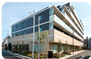
ソライエアイル練馬北町 (外観)