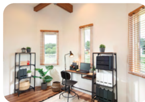
ホームオフィスのある家 (2020年分譲)

拡大する在宅勤務に対応した住宅の供給を進めています。2021年春に分譲した戸建住宅「ソライエ清水公園アーバンパークタウン」では、「テレワークスペースのある家」や「シアターピットのある家」など1邸ごとにコンセプトを設けており、「テレワークスペースのある家」では、緑を感じながらリラックスして仕事に取り組めるよう、居室レイアウトを配慮した間取りを提供しています。