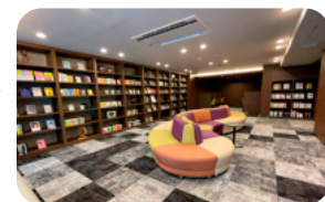
ソライエグラン流山おおたかの森 (共用部)