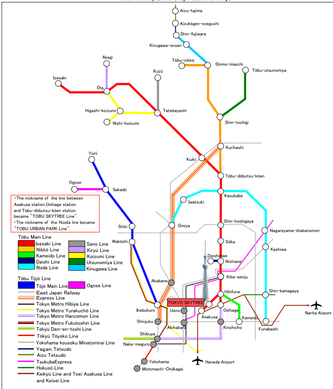
Tōbu Railway Lines (major stations only)