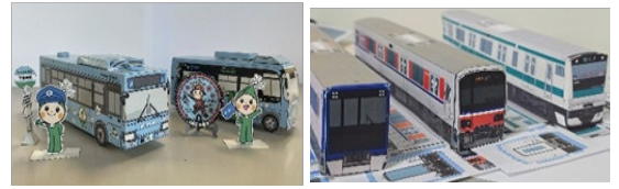
ペーパークラフト