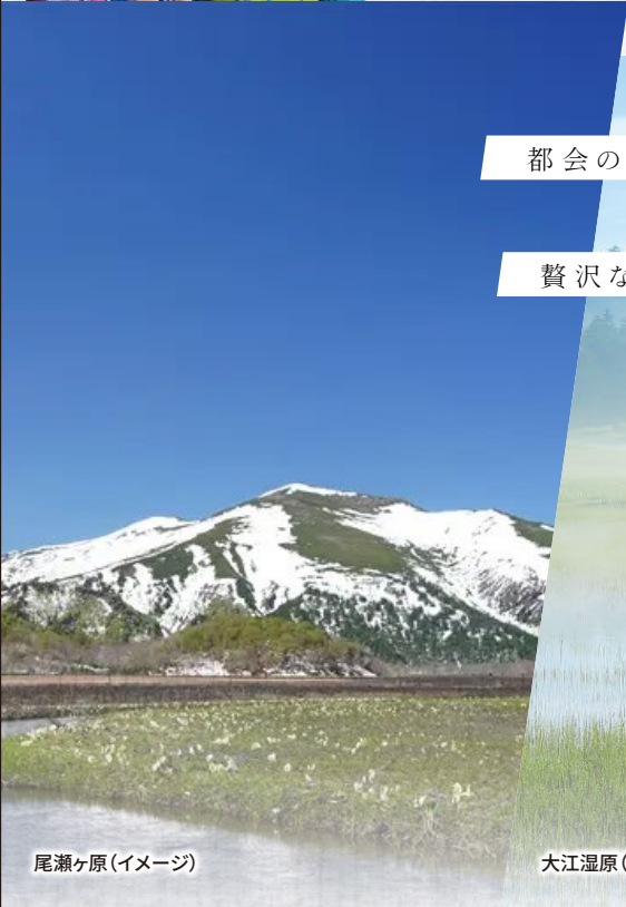
尾瀬ヶ原(イメージ)