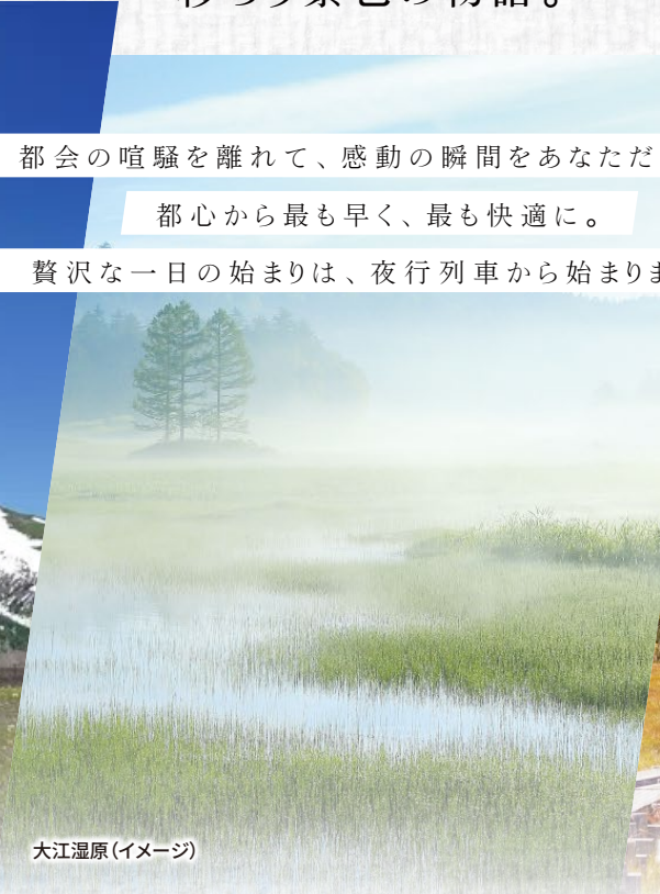
大江湿原(イメージ)