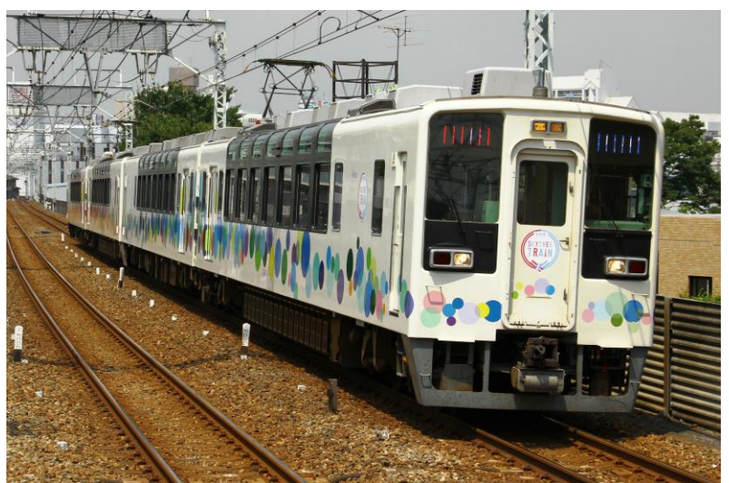
△「ソーシャルディスタンス日光号」で使用するスカイツリートレイン