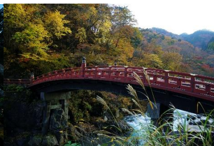
△日光二荒山神社 神橋