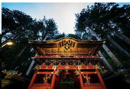
△日光山輪王寺大猷院