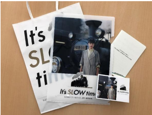
△配布ノベルティグッズ (イメージ)