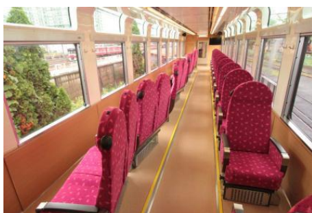
△スカイツリートレインの車内