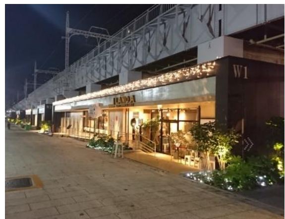
東京ミズマチ イルミネーション