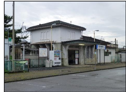
△工事着手前の駅舎外観