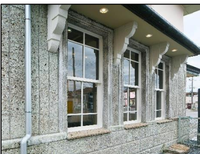
△縦長の三連窓と庇の持ち送り