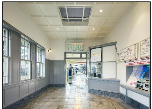
△開業当初を再現した待合室