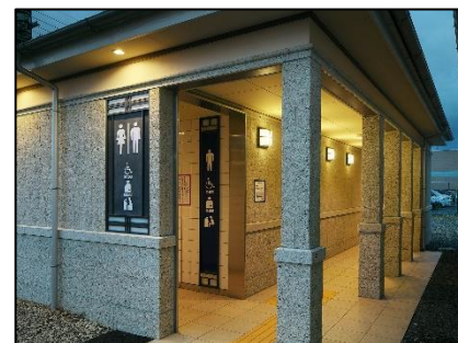
△リニューアルしたお客さま用トイレ