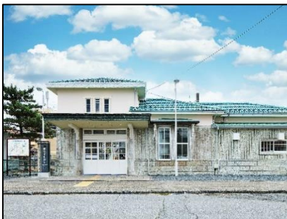
△大谷石と洋風瓦が特徴的な駅舎

修復にあたり開業当時からある縦貼り・横張りの大谷石、縦長の三連窓、出入口上部の欄間、待合室内の格天井、庇の持ち送りなどは補修により保存しつつ、新たに大谷石の壁面を増設し、全体のデザインを統一しました。青緑色の洋風瓦は、釉薬の調合と試し焼きを繰り返し、同駅新築時の色合いを再現すると共に、待合室内装などの塗装面は塗膜を調査・分析し、開業当初の塗装色に塗り直しています。また、特徴的な破風板は、宇都宮市宮原球場の最寄駅であることに由来するバットとボールを模した開業当初のデザインに修復しました。なお、同駅待合室には、宇都宮市や東武博物館にご協力いただき大谷石の文化や魅力の発信を目的としたパネルを設置します。