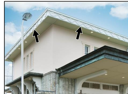
△バットとボールを模した破風板