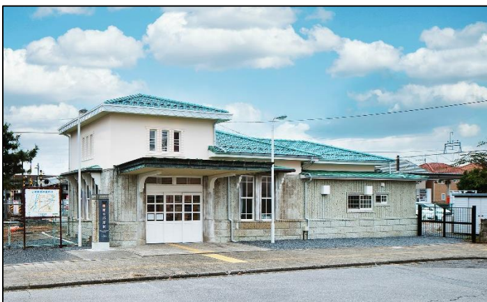
△リニューアルした南宇都宮駅 駅舎