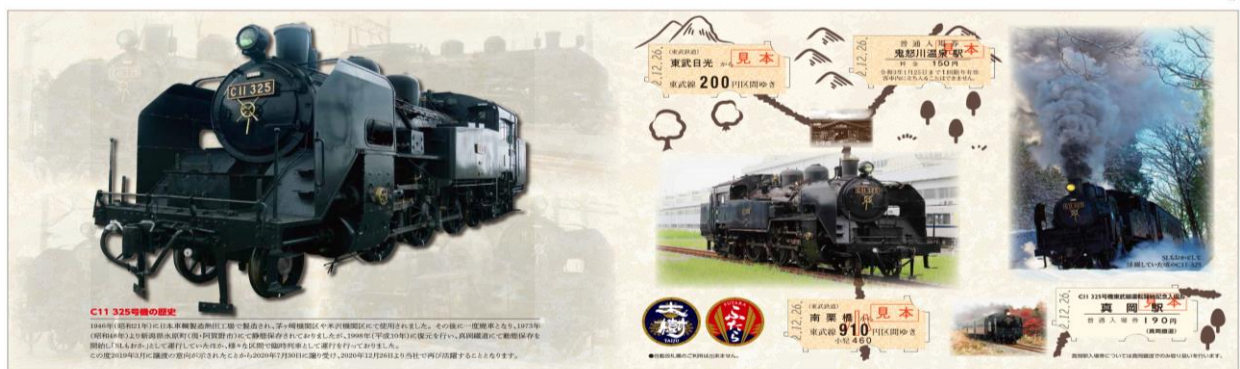
「C11 325号機 営業運転開始記念券」台紙イメージ