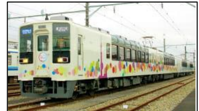
△スカイツリートレイン