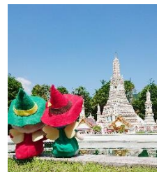
△東武ワールドスクウェア