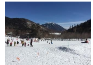
△日光湯元温泉スキー場