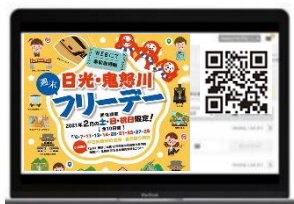
△特設サイトから事前予約申込(イメージ)

※各実施日につきおひとり様2人分まで申込み可能ですが、パスはおひとり様1枚です。