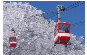
△明智平ロープウェイ