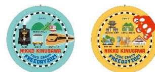
△オリジナル缶バッジ（イメージ） 左：9日まで、右：10日以降