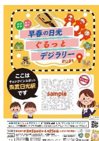
△スタンプポイントに掲示してある ポスター（イメージ）