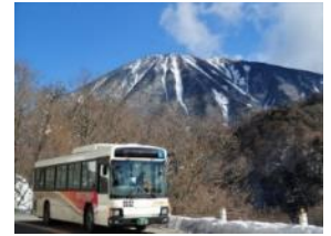
△日光・奥日光エリアのバス (東武バス日光)