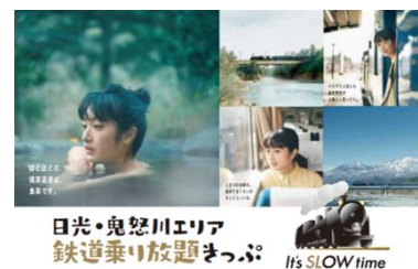
△日光・鬼怒川エリア鉄道乗り放題きっぷ