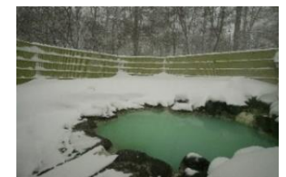
△露天風呂「森乃精」 (日光アストリアホテル)