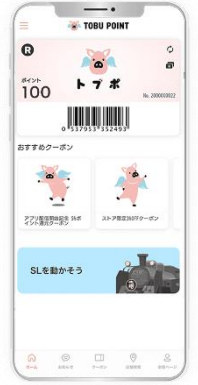
△TOBU POINT アプリ