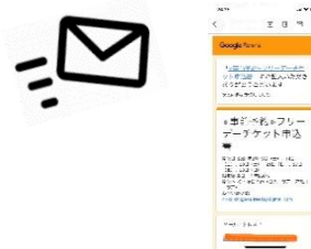
△当日予約完了メール画面を提示(イメージ)