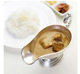
△百年ライスカレー(イメージ)