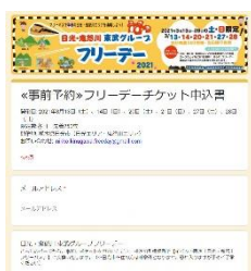
△申込フォームに必要事項を入力して送信(イメージ)