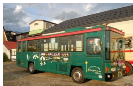
▲レトロバス猿遊号