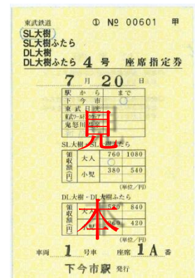
▲座席指定券イメージ