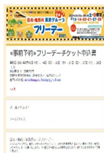
△申込フォームに必要事項を入力して送信 (イメージ)