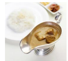
△百年ライスカレー (イメージ)

※ 事前申込可 (購入時に「日光・鬼怒川エリア週末フリーパス」を提示いただきます。)