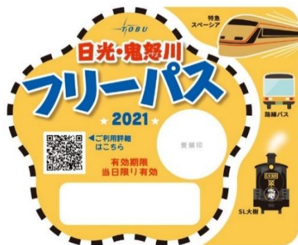
△日光・鬼怒川フリーパス（イメージ）