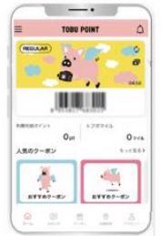
△TOBU POINT アプリ (イメージ)