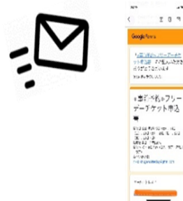
△当日予約完了メール画面を提示(イメージ)