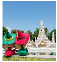
△東武ワールドスクウェア