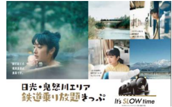
△日光・鬼怒川エリア鉄道乗り放題きっぷ (イメージ)