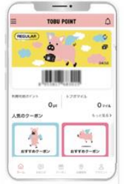
△TOBU POINT アプリ (イメージ)