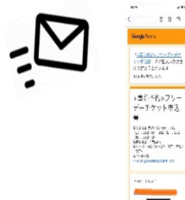
△当日予約完了メール画面を提示(イメージ)