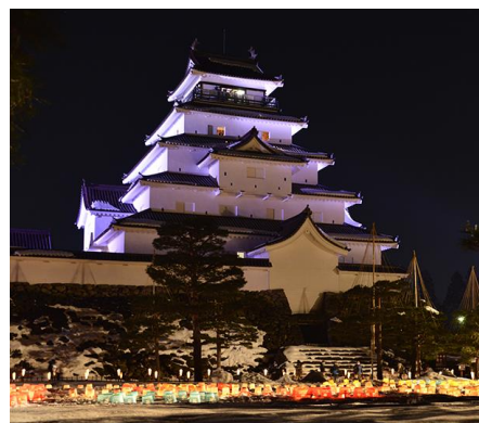
△会津絵ろうそくまつり （イメージ）