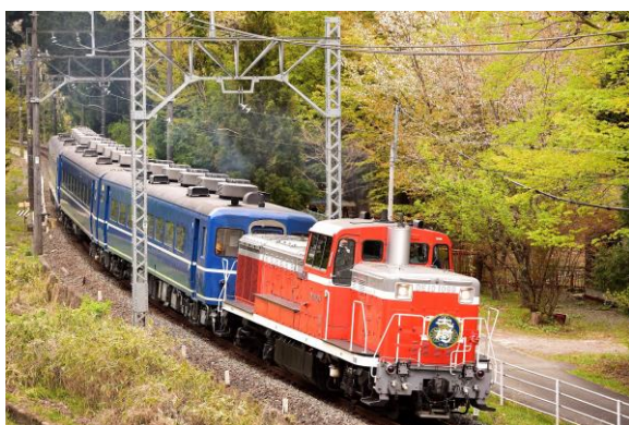
△会津田島駅に乗り入れるDL大樹（DE10 1099）