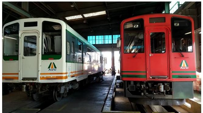
△会津鉄道車両基地 (イメージ)