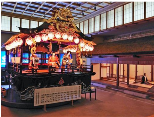
△会津田島祇園会館 (イメージ)