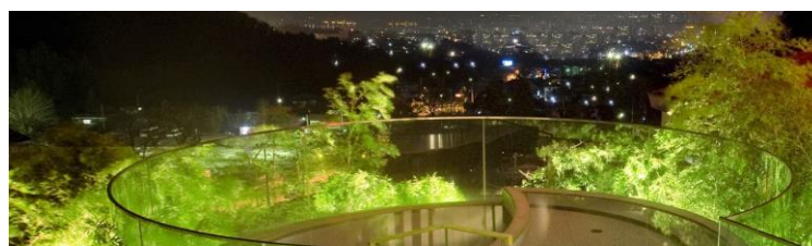
△東鳳露天風呂(イメージ)