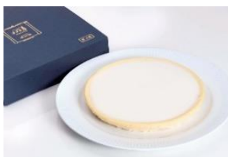
△チーズケーキ 日瑠華（ニルバーナ） （イメージ）