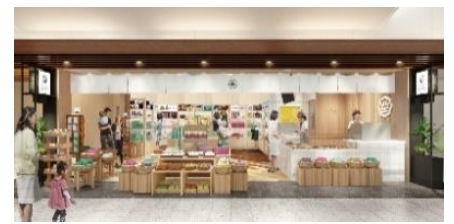
△東京ソラマチ 空の小町（イメージ）