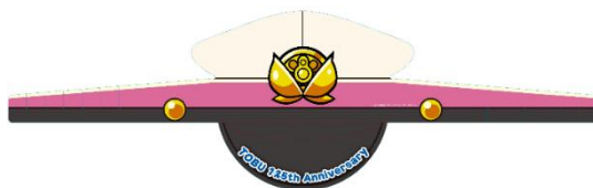
▲オリジナルペーパーサンバイザー(イメージ)