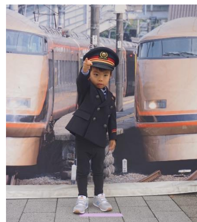
▲制服体験(イメージ)