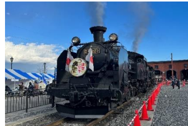
▲一昨年のSLファンフェスタの様子