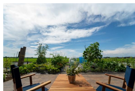
△ 畑住処(コテージ・畑)