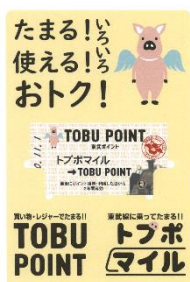
※乗車券柄マグネット（イメージ）

※現在、TOBU POINTでは、ウルトラマンデッカースタンプラリーや他のスタンプラリーを開催中！