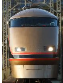
100系スペース（日光詣）