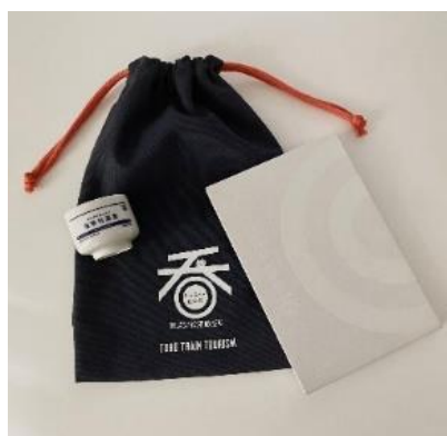
△#ふら呑みセット(イメージ)

※数量限定のため、無くなり次第終了しますが、随時新しいデザインの商品がリリース予定です。