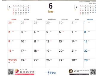
6月「大樹とレトロな新高徳駅」 △イメージ