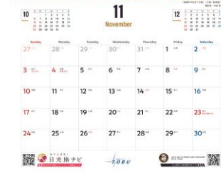
11月「黄葉の中を往く大樹」 △イメージ