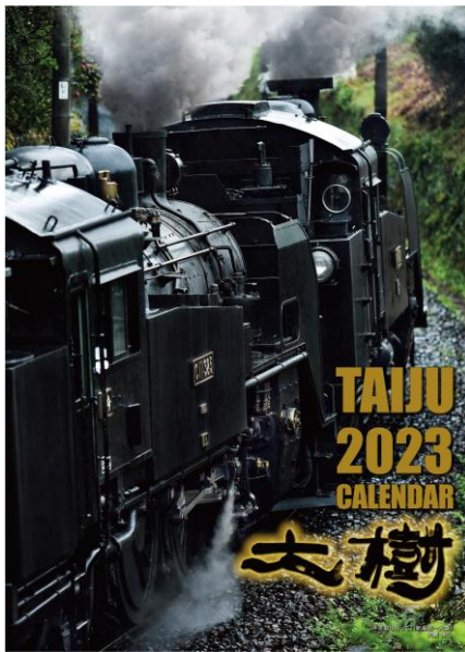
△前年2023「SL大樹カレンダー」表紙 (手を取り合って)