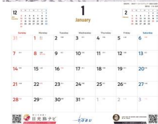
1月「銀世界」 △イメージ