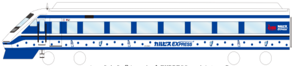
りょうもう『カルピス』EXPRESS (イメージ)

2024年3月31日(日)に運行を開始する<りょうもう『カルピス』EXPRESS>記念列車で行く撮影会およびジャンク市参加権付の撮影会ツアーを実施いたします。また、撮影会ツアーのオプションとして4月13日(土)東武商事施設(最寄駅:東武スカイツリーライン春日部駅)にて開催予定のジャンク市の参加権付もご用意しました。詳細については下記の通りです。また撮影会場となる葛生駅構内では、一般のお客様もお楽しみいただける「葛生(くずう)マルシェ」も同時開催いたします。みなさまのご参加をお待ちしております。