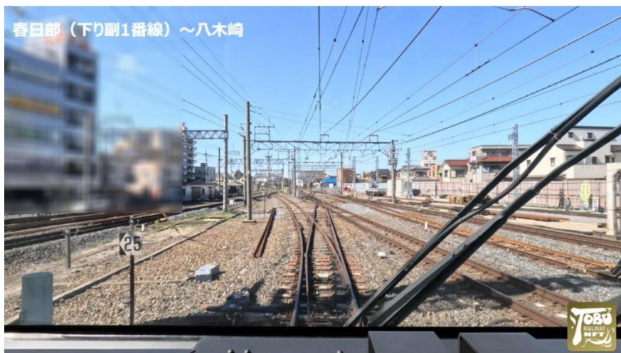
△走行シーン（キャプチャ）