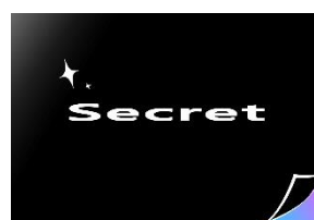
△カードデザインイメージ