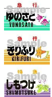
△発売商品イメージ