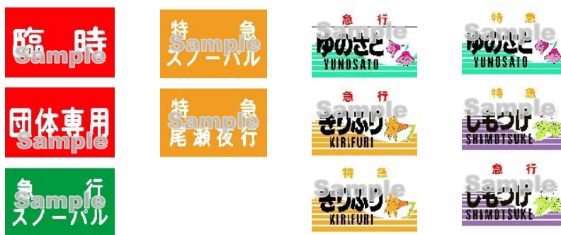
△デザインイメージ