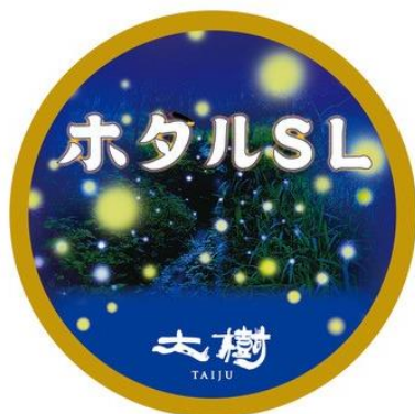
オリジナルヘッドマーク（イメージ）