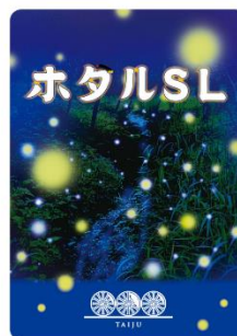
オリジナルカード 表面・裏面（イメージ）