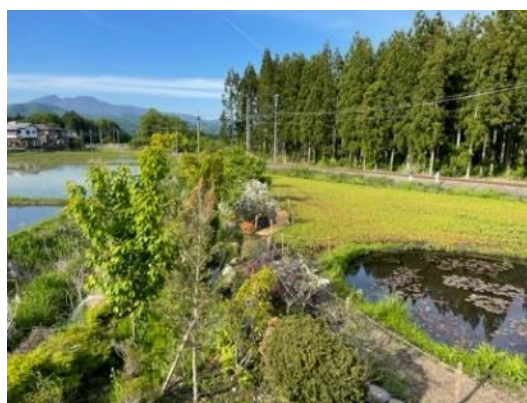
△倉ヶ崎S L花畑の小川（イメージ）