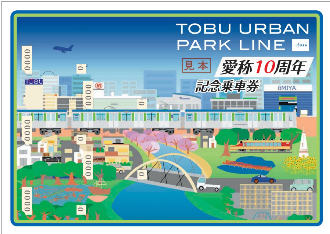
△台紙表面（A4サイズ2つ折り・A5サイズ）