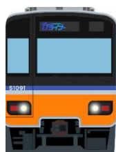
東上線 Tojo Line

アプリ内のスタンプ帳ラベルには、各路線を運行する代表的な車両を、またデジタル駅スタンプについては、その地のゆかりのあるものや車両、駅舎などをイメージしたイラストです。どの駅にどんなスタンプがあるかもお楽しみください。