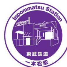
▲一本松駅スタンプ

※「エキタグ」および「デジタル駅スタンプ」は株式会社ジェイアール東日本企画の登録商標です。