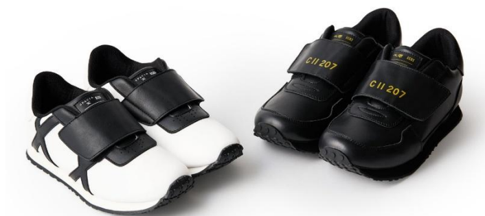
スペース X・S L 大樹コラボシューズ