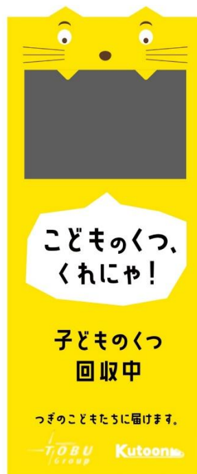
寄付回収ボックス