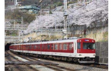
近鉄標準色イメージ