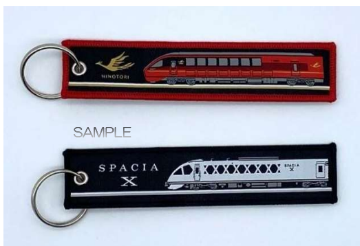
ひのとり・スペース Xトレインタグセット 1,000円(税込み)