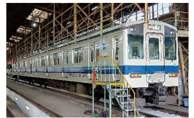
「東武8000系風」近鉄電車