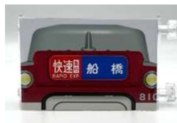
近鉄×東武 コラボミニミニ方向幕 (2個セット) 3,500円(税込み)