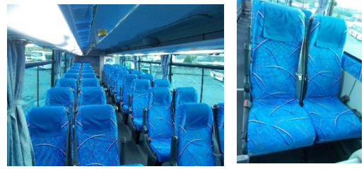
△高速バス4列シート（イメージ）