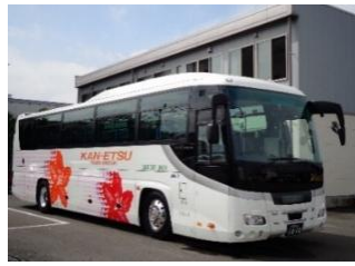
△関越交通高速バス（イメージ）