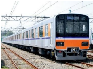
△東武東上線（イメージ）

東武鉄道株式会社（本社：東京都墨田区）と関越交通株式会社（本社：群馬県渋川市）では、 2026年6月6日（土）出発分～2026年10月18日（日）帰着分の期間限定で、東武東上線・越生線各駅から川越駅までの往復割引運賃と、関越交通の高速バス「尾瀬号」の往復割引運賃がセットになった「東武鉄道&関越交通 川越駅乗換で行く！高速バス「尾瀬号」往復デジタルクーポン」を発売いたします。