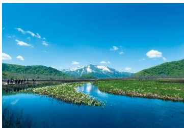
△尾瀬ヶ原（イメージ）