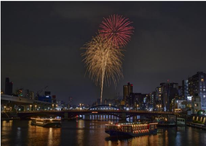
△すみだリバーウォークから見た花火

隅田川の上から花火大会を鑑賞できる特別な機会で、全80席をご用意しました。にぎわう周辺地域から隔たれ、特別に用意された隅田川の上にある座席で、ゆったりと花火を鑑賞いただけますので、ぜひお越しください。