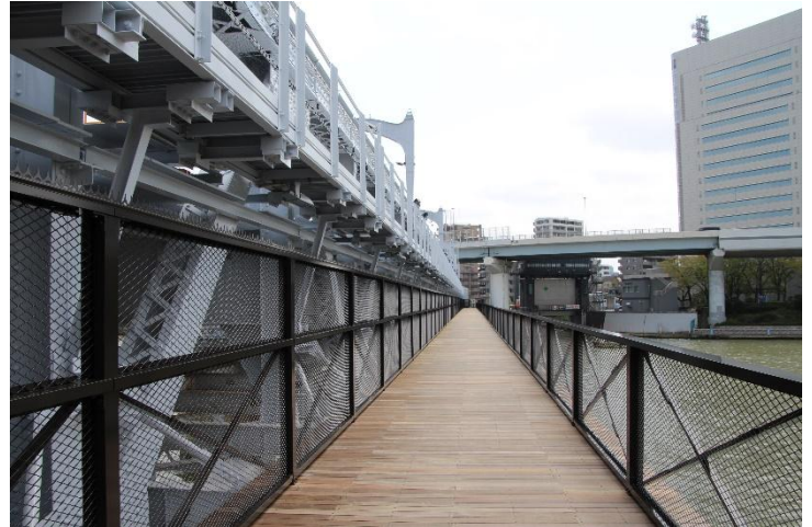
△台東区側から見た すみだリバーウォーク

お問い合わせは、東武トップツアーズ(株) 押上支店 電話 05-9002-1471 050-9002-1471