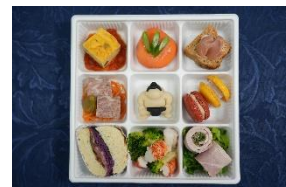
△ホテル製オードブルセット